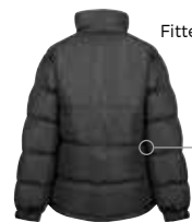
R181F BLACK (BLK)